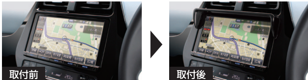
※写真は9インチナビです。