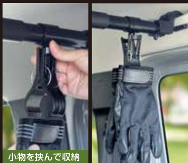
小物を挟んで収納